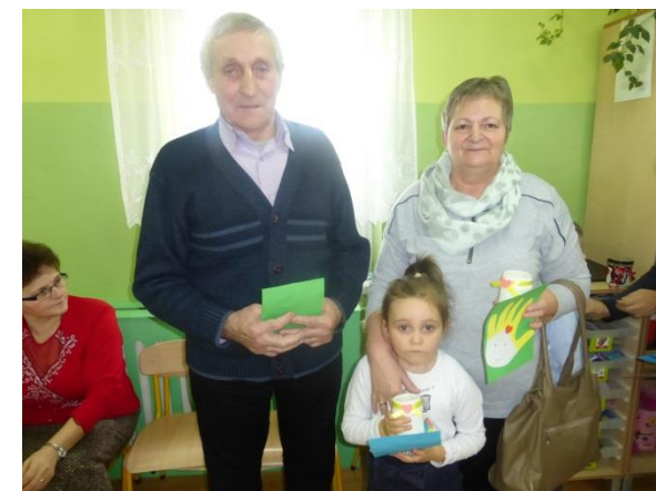
Dzieci wręczyły gościom upominki