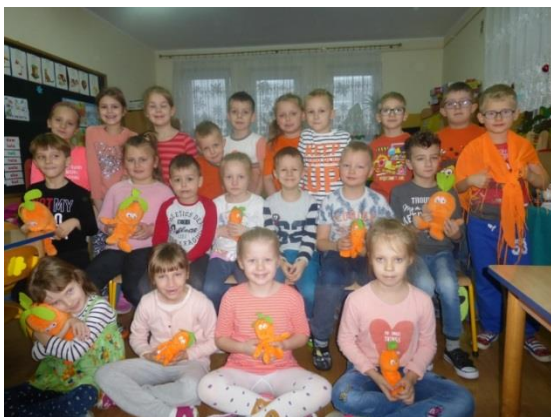
Wiewiórki w pomarańczowych barwach

W ramach realizacji programu Kubusiowi Przyjaciele Natury grupa trzecia zorganizowała Dzień Marchewki.