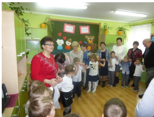
Zabawy integracyjne w grupie drugiej

W ramach obchodów Dnia Babci i Dziadka odbyły się uroczystości we wszystkich oddziałach przedszkolnych. Każda grupa pod kierunkiem nauczycielek przygotowała program artystyczny, konkursy, zabawy i upominki dla gości. Celem spotkań było przede wszystkim budzenie przywiązania i szacunku do rodziny oraz czerpanie radości z przygotowania niespodzianki najbliższym.