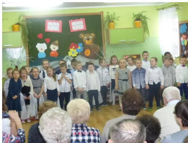
Występ artystyczny Misiów