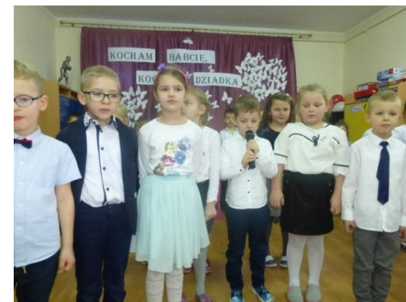
Występ artystyczny grupy trzeciej