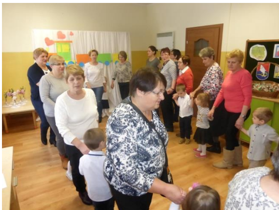
Taniec Muchomorków z zaproszonymi gośćmi