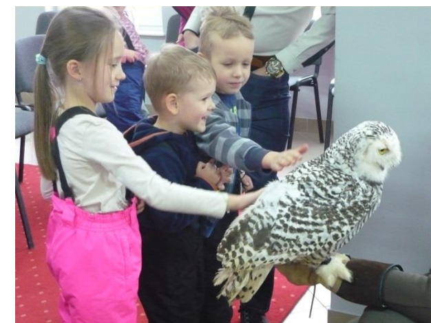
Pokaz żywych ptaków w Centrum Kultury

„Czas to najlepsza cenzura, a cierpliwość - najdoskonalszy nauczyciel”