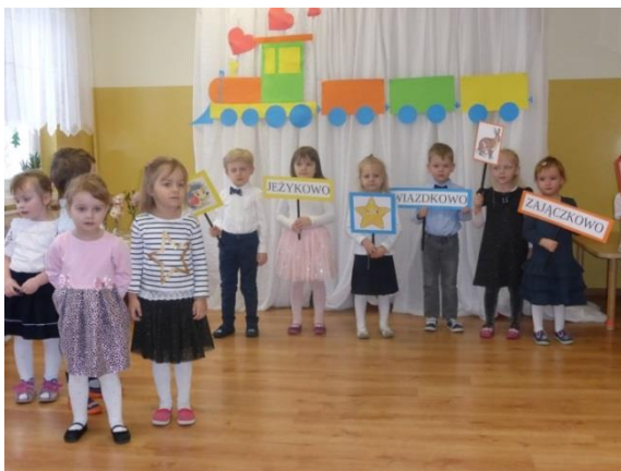
Dzień Babci i Dziadka w grupie pierwszej