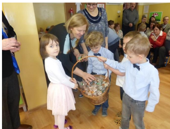
Prezenty dla babć i dziadków