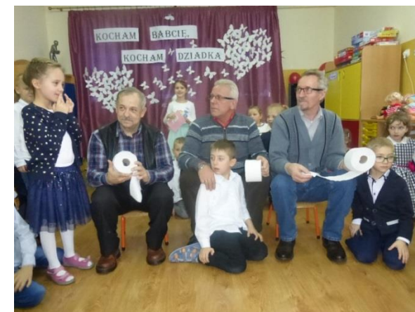
Konkursy z babcią i dziadkiem u Wiewiórek