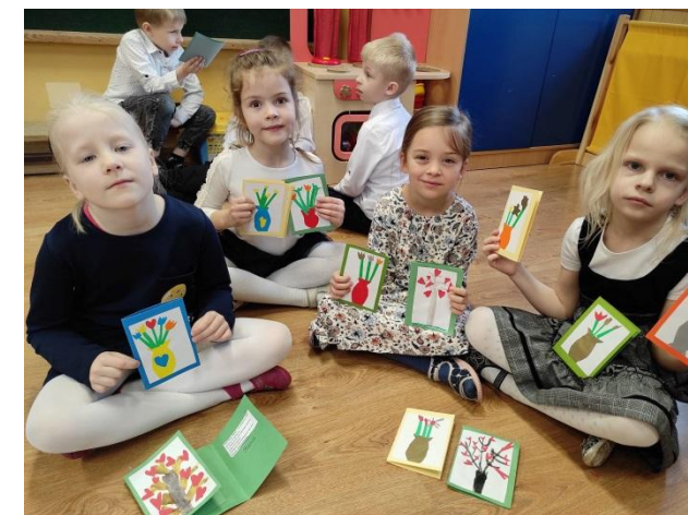
Laurki dla babć i dziadków

„Dom jest tam, gdzie chcą, żebyś został dłużej.” Stephen King