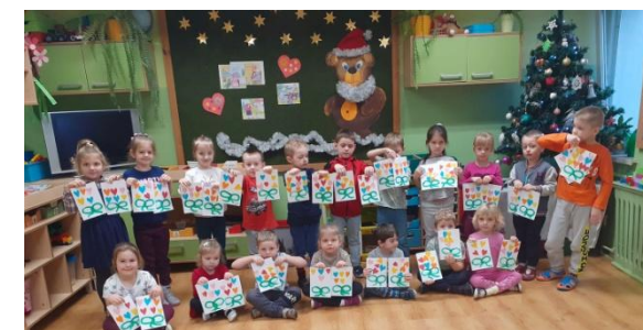
Misie z upominkami dla babć i dziadków