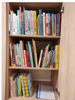
Biblioteczka z nowymi książkami

Narodowy Program Rozwoju Czytelnictwa 2.0