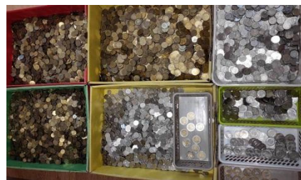
Segregowanie i przeliczanie