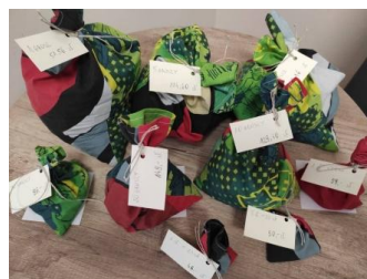
Spakowane monety gotowe do wysyłki