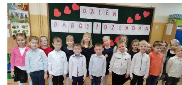
Wiersze i piosenki grupy trzeciej udostępnione za pomocą komunikatorów internetowych