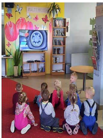
Zajęcia czytelnicze w bibliotece

Przedszkole zostało wyposażone w komplet pomocy sensorycznych do realizacji programu profilaktycznego SensoLyke .