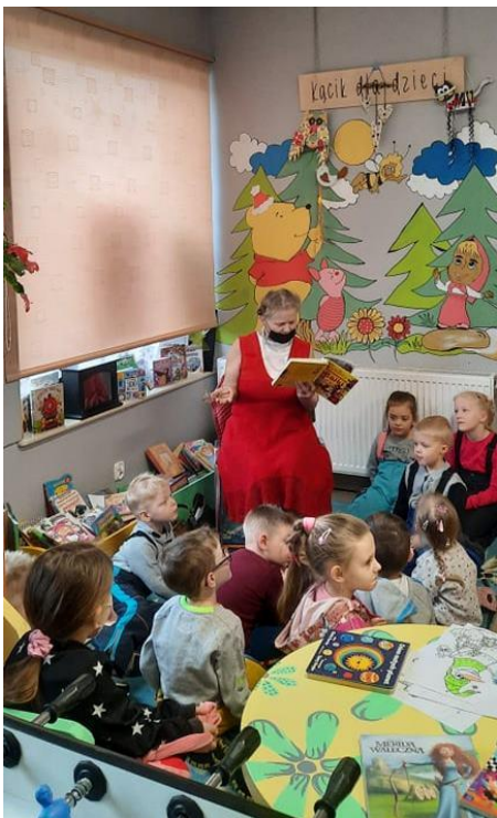
Dzieci z uwagą słuchają opowieści i bajek

Wycieczka do Gminnej Biblioteki Publicznej. Dzieci uczestniczyły w bajkowym poranku, który poprowadziła członkini Dyskusyjnego Klubu Książki.