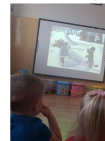
Realizacja projektu „Magiczna moc bajek”