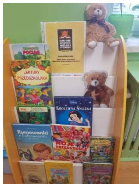
Kąciki książek w salach zajęć

Pozyskaliśmy kwotę 2 500,- złotych na zakup nowości wydawniczych dla dzieci w wieku przedszkolnym przy poniesionych kosztach własnych w kwocie 625,- złotych na realizację działań promujących czytelnictwo.