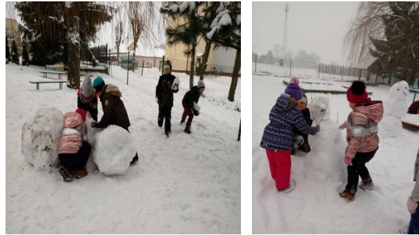
Wiewiórki pochłonięte zabawą

Dbając o zdrowie i hartując organizm dzieci, często wybieramy się na plac zabaw. Śnieg pozwala na kreatywne zabawy – rzucanie śnieżkami do celu, chodzenie po śladzie, lepienie kul i bałwana.