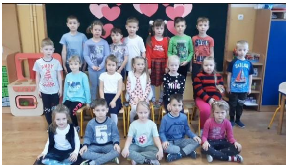
Wiewiórki tuż przed programem artystycznym