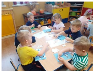
Zajęcia plastyczne w grupie pierwszej

Podczas ferii zimowych, w związku z mniejszą liczbą dzieci w przedszkolu, zajęcia były prowadzone w dwóch grupach. W drugim tygodniu ferii, ze względu na zachorowanie jednego dziecka na COVID-19, zajęcia odbywały się tylko w grupie pierwszej.