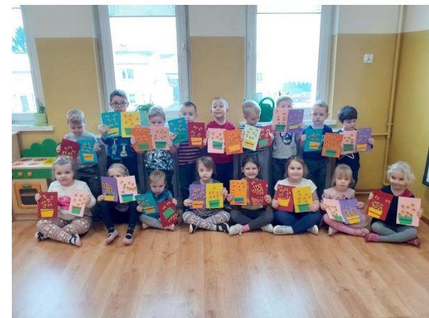
Muchomorki wykonały laurki

Dzieci ze wszystkich grup przygotowały upominki dla babć i dziadków.