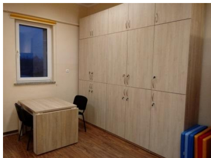
Nowe meble już ustawione