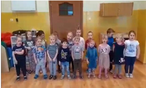
Muchomorki podczas występu

Pomimo trwającej pandemii pamiętaliśmy o Dniach Babci i Dziadka. Każda grupa przygotowała krótki program artystyczny, który udostępniłmy na Facebooku i Messengerze. Dzieci obdarowały także swoich bliskich samodzielnie wykonanymi upominkami.