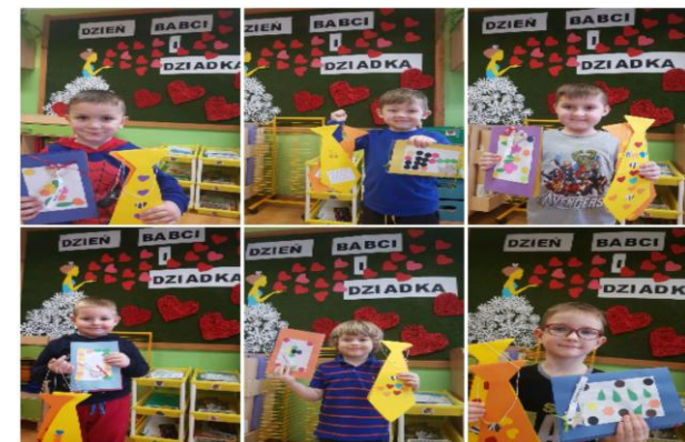
Upominki przygotowane w grupie drugiej