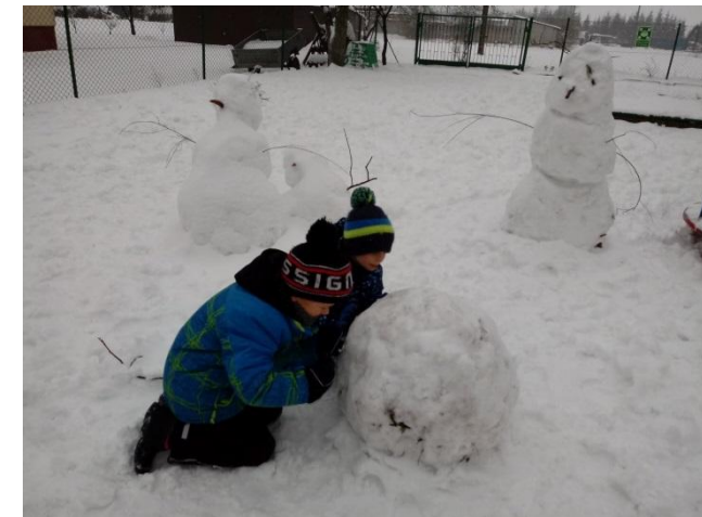
Zabawy na śniegu