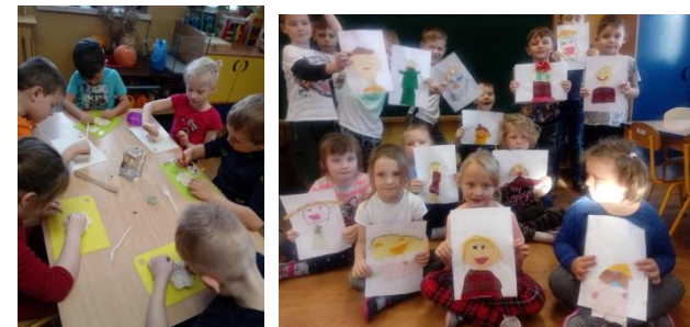
Najstarsze przedszkolaki wykonały świeczniki i portrety