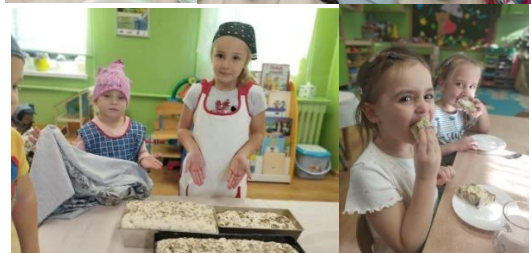
Pieczenie i degustacja chleba