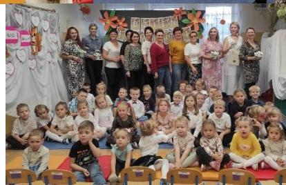
Obchody Dnia Edukacji Narodowej