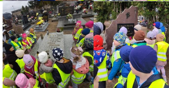
Wizyta na cmentarzu