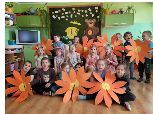
Powitanie wiosny w grupie drugiej

„Najpiękniejszą wiosną jest dobroć serca”. Nikolaus Lenau