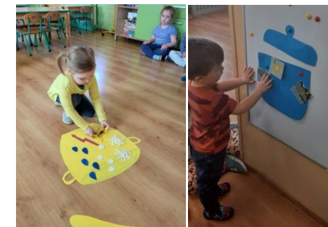
Muchomorki podczas zajęć

Dzieci próbowały odgadnąć co kryje się w przysłowiu „W marcu jak w garncu”.