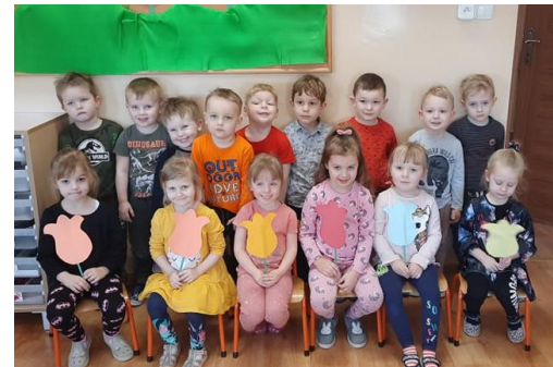
Muchomorki podczas Dnia Kobiet