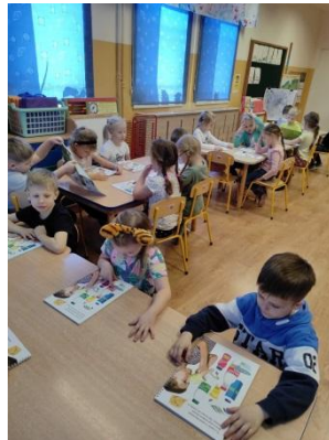
Wiewiórki podczas zajęć