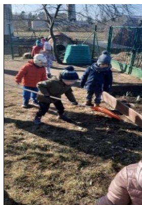
Prace w ogrodzie