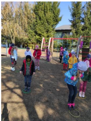
Ćwiczenia gimnastyczne grupy trzeciej

Przedszkolaki włączyły się w akcję „Rusz się na Wiosnę” w Gminie Rybno.