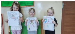
Muchomorki prezentują swoje prace

W ramach realizacji programu „Mały miś w świecie wielkiej literatury” przedszkolaki uczyły się pozytywnego myślenia.