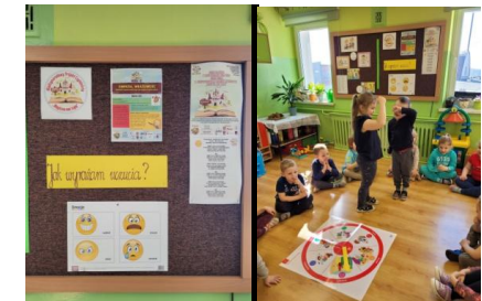
Misie w czasie wyrażania uczuć

W ramach projektu Magiczna Moc Bajek przedszkolaki wyrażały swoje uczucia (strach, złość, zazdrość, radość, smutek, szczęście) za pomocą gestów.