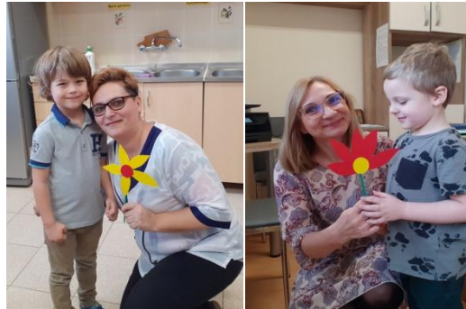
Chłopcy z grupy drugiej składają życzenia

W Dniu Kobiet chłopcy złożyli życzenia paniom i dziewczynkom.