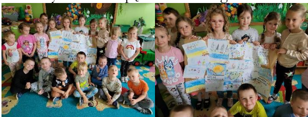
Misie ze swoją pracą

Przedшкоlaki przygotowały kolaż rodzinnych marzeń i pragnień, który był punktem wyjścia rozmowy na temat spędzania wolnego czasu.