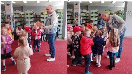
Wizyta w bibliotece

Z okazji Ogólnopolskiego Dnia Bibliotekarza i Bibliotek, przedszkolaki złożyli życzenia Panu Dyrektorowi i wszystkim pracownikom Gminnej Biblioteki Publicznej w Rybnie.