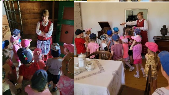
Wycieczka Wiewiórek i Misiów