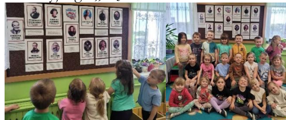
Gazetka „Sławni Polacy”

Grupa Misiów zrealizowała zadanie 12 projektu edukacyjnego „Piękna Nasza Polska Cała”..