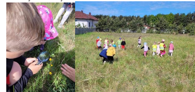
Obserwacje przyrodnicze łąki

Przedszkolaki wybrały się na łąkę, aby obserwować rośliny i owady.