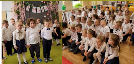
Muchomorki podczas uroczystości