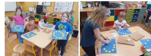
Wiewiórki wykonują flagę Unii Europejskiej

Przedszkolaki poznawały kraje sąsiadujące z Polską – ich zabytki, kulturę, zwyczaje.