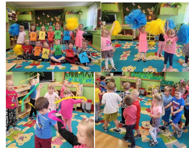
Misie w czasie zabaw tanecznych

W grupie Misiów zorganizowano Dzień Tańca, aby rozbudzać zainteresowania muzyczne na drodze obcowania z dźwiękiem i rytmem.