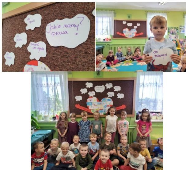
Misie znają prawa dziecka

Przedszkolaki z drugiej grupy rozmawiały na temat Praw Dziecka.