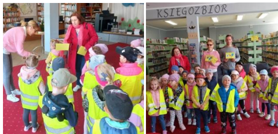
Muchomorki w bibliotece

Najmłodsza grupa złożyła życzenia pracownikom Gminnej Biblioteki Publicznej w Rybnie z okazji Dnia Bibliotekarza.