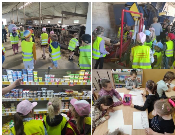
Dzień Mleka w grupie 5-6 latków

Najstarsza grupa w ramach Dnia Mleka uczestniczyła w wycieczce do gospodarstwa rolnego oraz do sklepu spożywczego, by poznać proces powstawania produktów mlecznych.