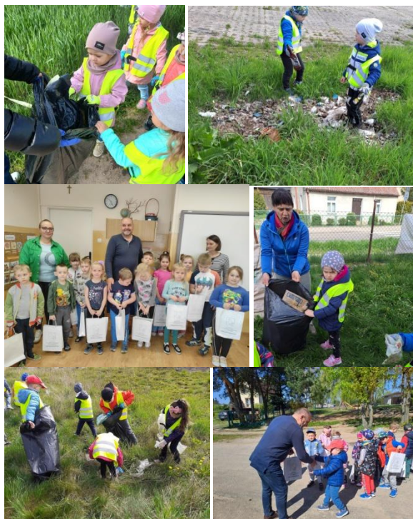
Przedszkolaki uczestniczące w akcji

Dzieci ze wszystkich grup wzięły udział w akcji „Trash Challenge - Przywróć Naszą Planetę 2023 Gmina Rybno”. Otrzymały za to drobne upominki z rąk Wójta Gminy oraz Inspektora ds. Ochrony Środowiska i Zdrowia.