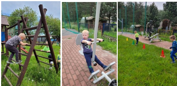
Misie podczas ćwiczeń

Korzystając z pięknej pogody grupa 4-5 latków uczestniczyła w zajęciach sportowych na świeżym powietrzu.