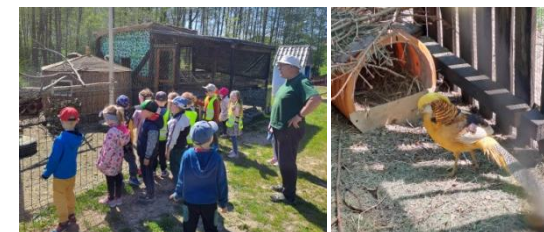
Przedszkolaki obserwują zwierzęta

Grupa druga wybrała się do Mini Zoo, by poszerzyć swoją wiedzę na temat zwierząt.