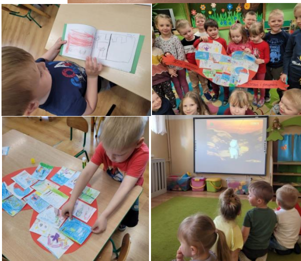
Przedszkolaki podczas realizacji zadań projektowych