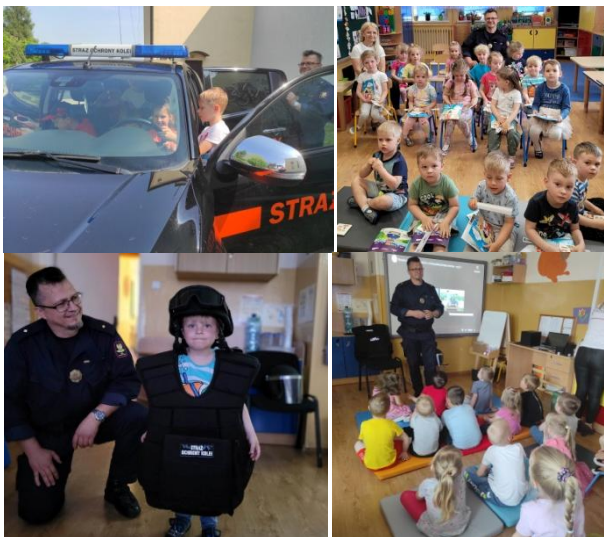
Spotkanie z pracownikami Straży Ochrony Kolei

W ramach kampanii społecznej „Bezpieczny przejazd” odwiedzili nas pracownicy Straży Ochrony Kolei. Dzieci z zainteresowaniem obejrzały filmiki edukacyjne, wysłuchały cennych uwag związanych z bezpieczeństwem na torach, na dworcu i w pociągu. Miały też okazję poznać i przymierzyć elementy umundurowania oraz samochód straży. Na zakończenie spotkania dzieci otrzymały upominki i przekazały gościom życzenia w formie laurek.