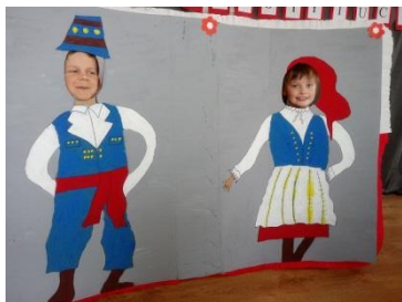
Fotobudka „Jesteśmy Polka i Polakiem”

Grupa trzecia pozowała do zdjęć w strojach ludowych Ziemi Lubawskiej XIX wieku.