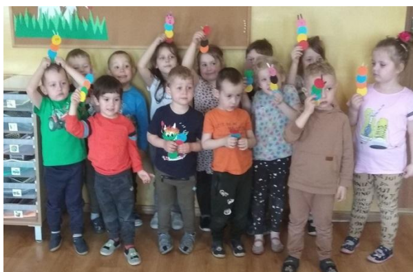
Maluszki wykonały zakładki do książek

Grupa Muchomorków obchodziła Dzień Bibliotekarza i Bibliotek. Rozwijano u dzieci zainteresowania czytelnicze poprzez utworzenie kącika książek, słuchanie wierszy i bajek, obdarowanie pracowników przedszkola zakładkami do książek.