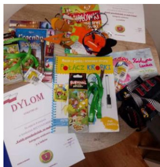
Dyplomy i nagrody