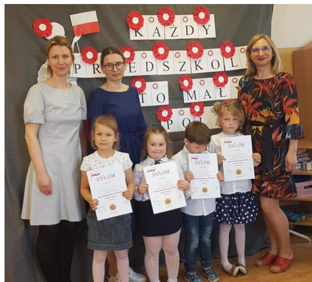
Zwycięcy w towarzystwie komisji konkursowej