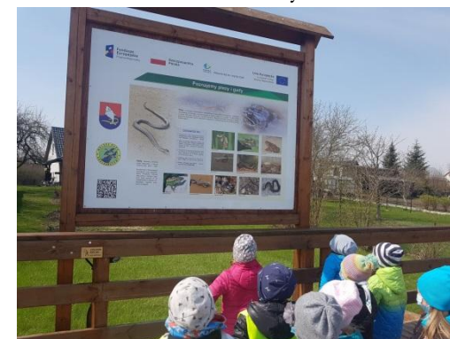
Wycieczka nad jezioro