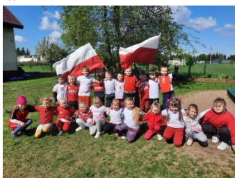
Tuz przed zawodami sportowymi

W grupie Wiewiórek odbyły się zawody sportowe pod hasłem „Biało-czerwon!”.