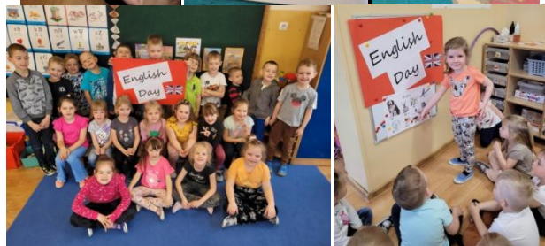
Zabawy z językiem angielskim