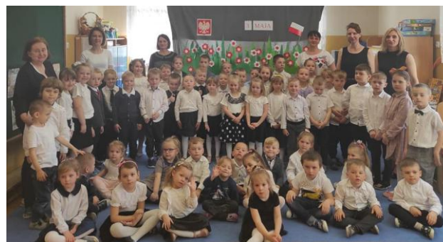
Obchody Święta Konstytucji

Uroczystość Święta Konstytucji 3 Maja. Dzieci ze wszystkich grup wspólnie odśpiewały hymn. Najstarsze przedszkolaki zaprezentowały wiersze i piosenki o Polsce. Uroczystość była okazją do upamiętnienia rocznicy uchwalenia Konstytucji oraz rozwijania poczucia przynależności narodowej.