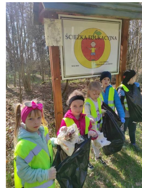
Akcja sprzątania w lesie

„Główna odpowiedzialność za ocalenie w całości zwierzęcego świata dla jutra, jest złożona na barki tych, którzy żyją dziś”.