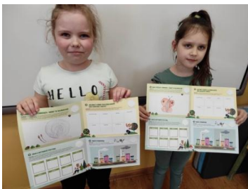
Wiewiórki prezentują karty pracy

Dzieci w ramach realizowanego programu ekologicznego „Kubusiowi Przyjaciele Natury” realizują wiele zadań ekologicznych i prozdrowotnych.