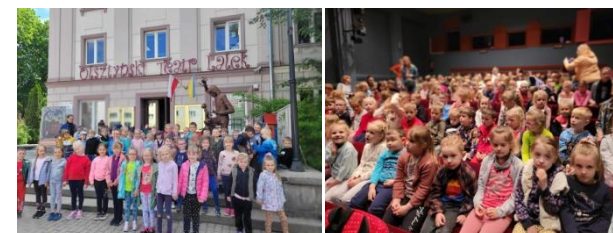
Tuż przed spektaklem

W ramach obchodów Dnia Dziecka zorganizowaliśmy wyjazd edukacyjno-rekreacyjny do Olsztyna. Pierwszym punktem wycieczki był Olsztyński Teatr Lalek, gdzie dzieci obejrzały spektakl „Czerwony Kapturek”. Kolejną atrakcją były warsztaty fizyczno-chemiczne „Ulica profesora Ryzyka-Fizyka” w Warmioliandii. Frajdą dla przedszkolaków było korzystanie z atrakcji typu: zjeżdżalnie, baseny z kulkami, trampoliny, konstrukcje zabawowe.