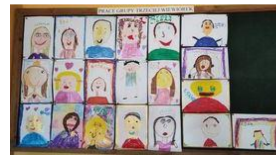
Autoportrety dzieci kończących przedszkole

"Dziecko może nauczyć dorosłych trzech rzeczy: cieszyć się bez powodu, być ciągle czymś zajęтым i domagać się ze wszystkich sił tego, czego pragnie."