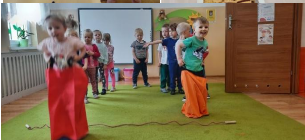
Obchody Dnia Dziecka

O dzieciach nie zapomnieli też seniorzy z Dziennego Domu Seniora w Rybnie, którzy obdarowali dzieci własnoręcznie wykonanymi zabawkami metodą origami oraz słodyczkami.