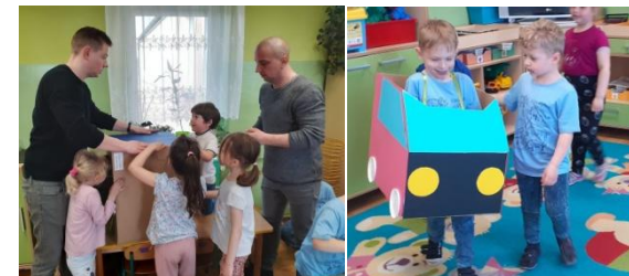
Wszyscy byli bardzo zaangażowani

Realizując projekt edukacyjny „Piękna Nasza Polska Cała”, grupa Misiów uczestniczyła w warsztatach z ojcami, podczas których wspólnie wykonano eko-pojazd z recyklingu.