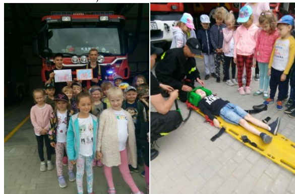
Spotkanie ze strażakami

Wiewiórki wybrały się do remizy strażackiej, aby poszerzyć wiedzę na temat bezpieczeństwa w czasie wakacji.