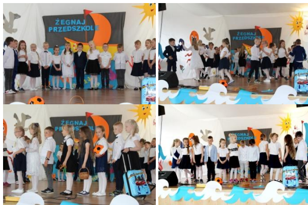
Program artystyczny w wykonaniu 5-6 latków

Odbyła się uroczystość zakończenia roku szkolnego, podczas którego pożegnaliśmy dzieci odchodzące po wakacjach do pierwszej klasy. Grupa Wiewiórek zaprezentowała program artystyczny. W uroczystości oprócz dzieci wzięli udział zaproszeni goście, rodzice przedszkolaków, pracownicy przedszkola.