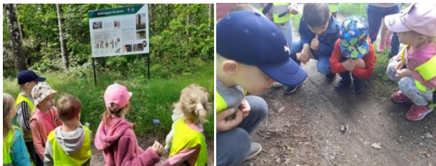
Wycieczka do lasu

Grupa 4-5 latków wybrała się na wycieczkę, aby obserwować przyrodę w lesie.