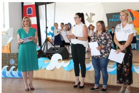
Podziękowania dla rodziców

Serdecznie dziękujemy Rodzicom i przyjaciółom, którzy wspierali nas w całorocznej pracy w roku szkolnym 2021/2022.